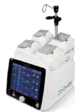
Coolief* 疼痛管理用高周波システム