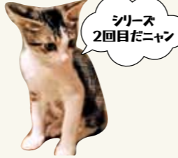
シリーズ 2回目だニャン