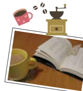
本棚にはミステリー小説がたくさん！

患者さまはご病気の事やこれからの生活の事など、不安が多いと思います。一人一人に合ったリハビリメニューの提案・実施のみではなく、関わらせて頂くことで、少しでも不安を軽減出来るような声かけ、表情、行動がとれるよう心がけていきます。